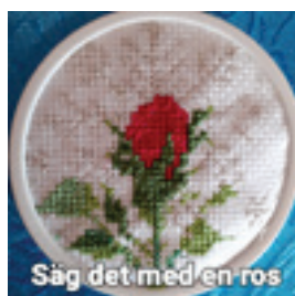
Säg det med en ros

Säg det med en ros av Margarita Andersson Finns att se fr.o.m. 18.1