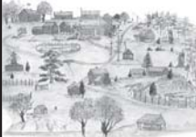
Jan Karlsgårdenin ulkoilmamuseo ja vankilamuseo Vita Björn